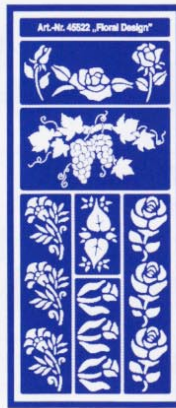
45522 Floral Design VE 6