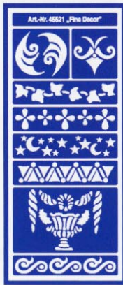
45521 Fine Decor VE 6