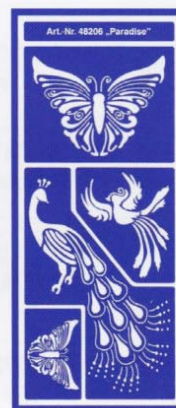
48206 Paradise VE 6