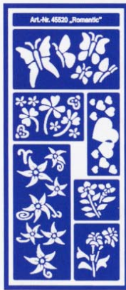
45520 Romantic VE 6

Zur Gestaltung von Stoff, Textilien, Seide, Frottee, Holz, Metall, Folie, Papier, Glas, Kunststoff, Leder, Keramik, Terracotta usw. Die flexiblen, selbsthaftenden Schablonen sind bestens für gewölbte Gegenstände und zum Satinieren mit Frost-Effekten (Katalogseite 161) geeignet.