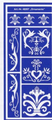
48207 Ornaments VE 6