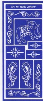
48202 Orient VE 6