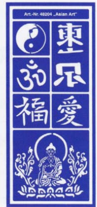
48204 Asian Art VE 6