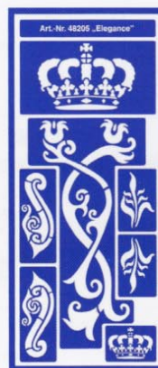
48205 Elegance VE 6