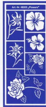
48203 Flowers VE 6