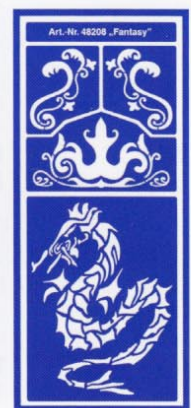
48208 Fantasy VE 6