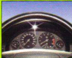
Autocockpit Car cockpit • Habitable de voiture Abitacolo autovettura