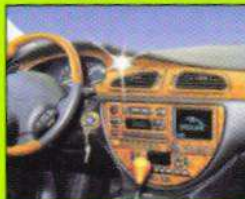
Wurzelholz Wood trim • Bois de racine • Radica