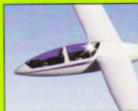
Flugzeugfenster Aircraft windows • Hublot d'avion Finestrino di aereo