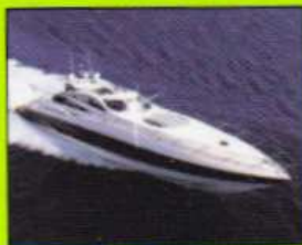
Bootsfenster Boat windows • Hublot de batea Obliò di nave