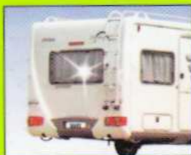
Wohnwagenfenster Caravan windows • Fenêtre de caravane Finestrino roulotte