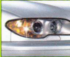
Frontscheinwerfer Headlamp • Voitures • Autovetture

Entfernt Kratzer aus Acryl- und Plexiglas®