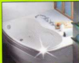
Acrylwannen Acrylic bath tubs • Baignoire acrylique Vasche da bagno in acrilico