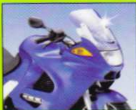
Motorrad Motorbikes • Motos • Motociclette