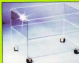
Acrylglassmöbel Acrylic glass furniture • Meubles en Plexiglas Mobili in vetro acrilico