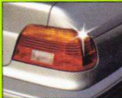
Rückleuchten Rear lamp • Voitures • Autovetture